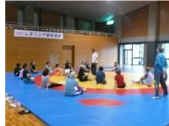
▲ストレッチの様子