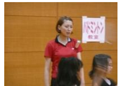
小椋 久美子 (バドミントン) 元女子バドミントン日本代表 北京五輪5位入賞