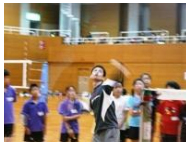
片山 卓哉 (バドミントン) 元バドミントン日本代表 自己最高世界ランク: 19位